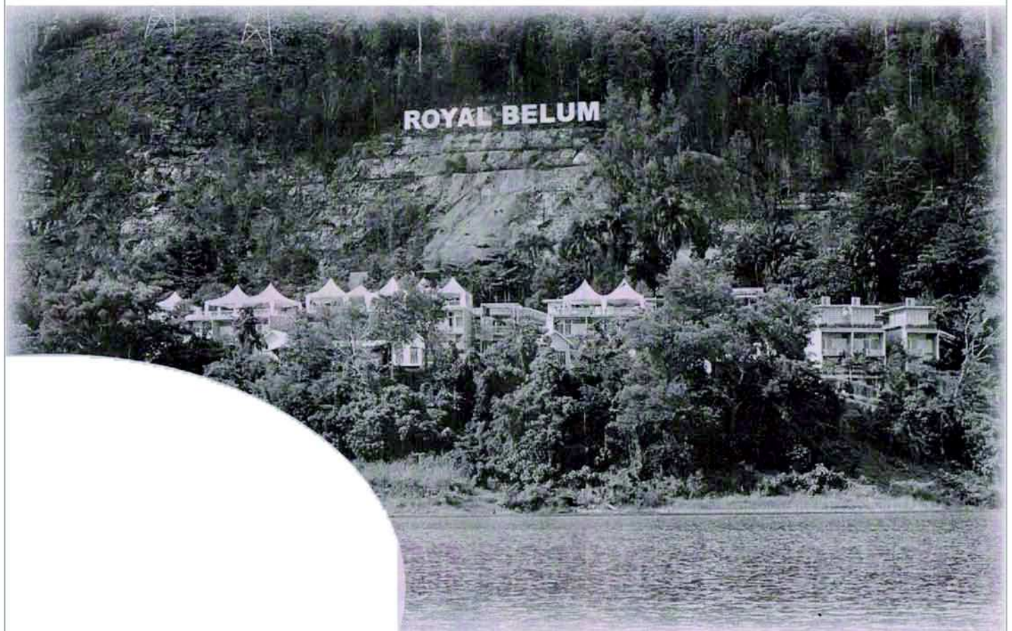
HARMONI: Pemandangan indah dan damai di Belum Rainforest Resort di Gerik. — Gambar Bernama

Ahmad Khalif berkata sekiranya perkara itu dapat direalisasikan dalam masa dua ke tiga tahun, maka Hutan Hujan Belum-Temenggor akan menjadi sumber pendapatan baharu di Perak. — Bernama