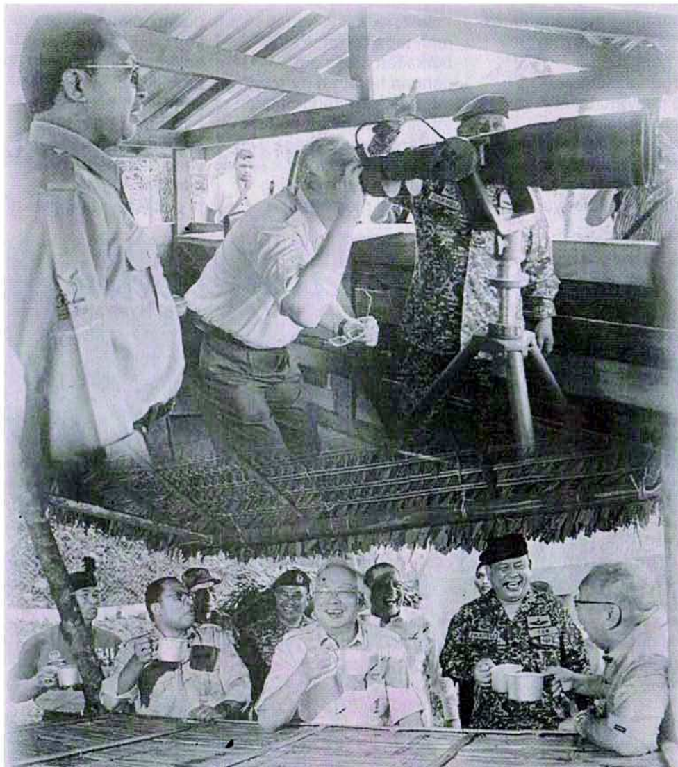
MESRA: Najib (tengah) ketika melawat Galeri Banding Memori Lebuh Raya Timur Barat yang terletak berhadapan dengan Belum Rainforest Resort di Gerik baru-baru ini.